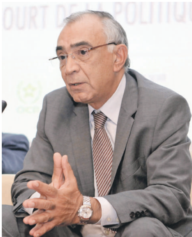
Omar Azziman, président du Conseil supérieur de l'éducation a souligné que «les projets prévus par la Vision 2030 nécessitent de grands budgets que l'Etat, seul, ne peut pas supporter. D'où l'importance d'offrir au gouvernement, dans le cadre de notre mission consultative, des pistes de réflexion pour diversifier les sources de financement

Quoi qu'il en soit, le débat semble aussi être victime d'incompréhension. Azziman a tenu à mettre les points sur les i. Il a d'abord précisé que son Conseil dispose d'un simple pouvoir consultatif. «La mise en place de frais d'inscription, et non pas