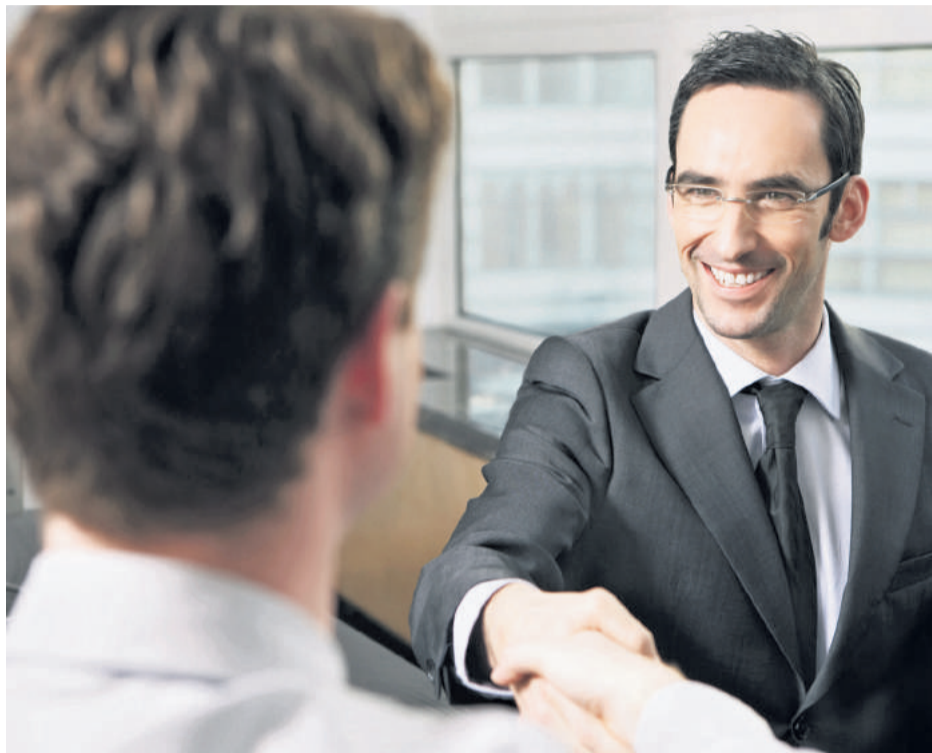
Selon l'étude Urbanbound réalisée début 2016, près de 35% des entreprises intégrant le processus onboarding aux Etats-Unis et aux Royaume-Unis avouent qu'il ne leur engendre aucune charge pécuniaire. Cette démarche nécessite en général moins de 2 mois (Ph. L'Economiste)

Il existe aujourd'hui plusieurs outils pour optimiser l'accueil et l'intégration des candidats et assurer leur fidélisation. Des outils qui répondent parfaitement aux attentes des collaborateurs et aux nouveaux usages et tendances en matière du numérique. Afin d'accompagner le