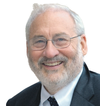
Joseph E. Stiglitz