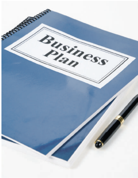
En 27 ans d'existence, l'Ecole polytechnique d'Agadir a constitué une banque de données de projets de création d'entreprise dans différents secteurs d'activité qui dépassent les 800 business plans couvrant différents secteurs économiques

■ Développer l'esprit d'entreprise, améliorer les intentions de création, ça marche depuis 27 ans!