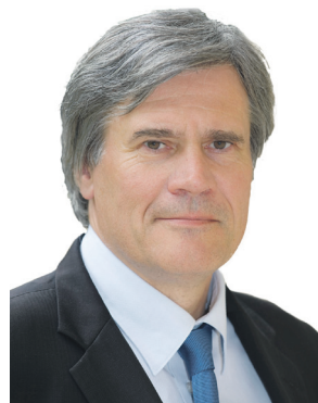
Stéphane Le Foll, ministre de l'Agriculture, de l'Agro-industrie et de la Forêt

Agriculture durable La recette de Stéphane Le Foll