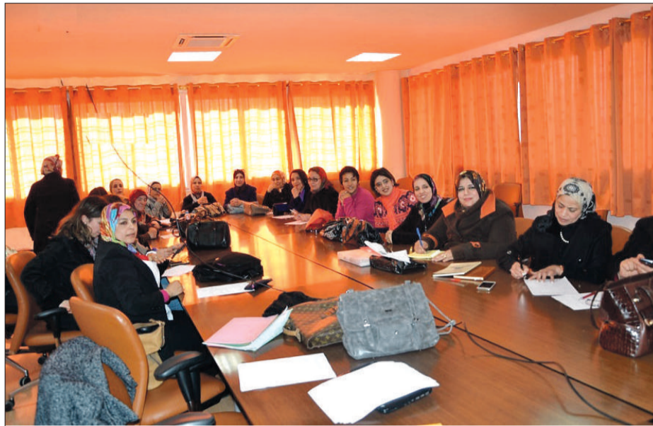
«Il est temps de réserver aux enseignantes-chercheuses les places qu'elles méritent au sein des établissements universitaires», soulignent les universitaires de l'AEC/UMP

DANS le sillage de la journée internationale de la femme, les professeurs femmes de l'Université Mohammed 1er d'Oujda ont créé leur association des enseignantes-chercheuses (AEC/UMP). Une décision attendue permettant de faire respecter la parité au sein de cette université. Les enseignantes qui représentent plus de 18% (150 enseignantes sur les 640 professeurs de l'UMP) n'assument aucune responsabilité de premier rang. Seules trois d'entre elles (0,35%) assurent des responsabilités à la fac de médecine et au sein des conseils universitaires. De plus, ces enseignantes chercheuses ne sont pas bien représentées au sein des conseils d'établissement et/ou d'université et différents départements et sec-