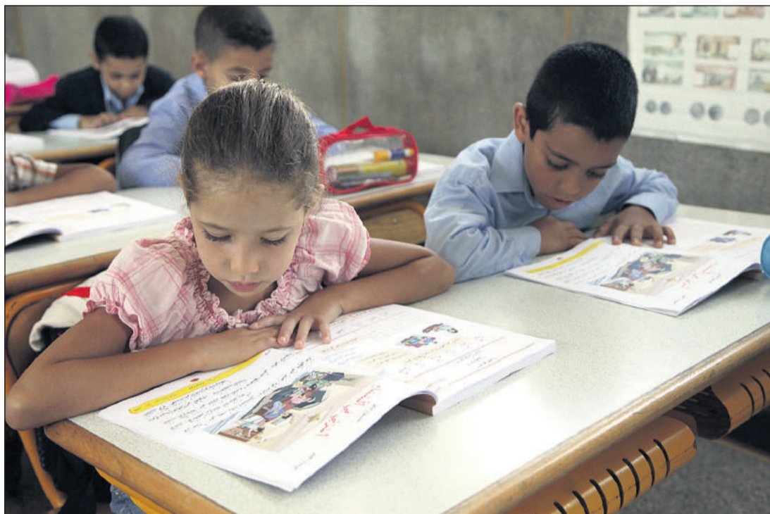
Le programme éducatif actuel est basé sur une approche «disciplinaire» inadaptée pour les enfants du primaire. Les apprentissages sont également «cloisonnés». Selon le ministère de l'Education nationale, 70% des mots appris sont abstraits pour les enfants, et leur fréquence de répétition est trop faible

La tutelle revoit donc en profondeur les apprentissages du primaire, dans le cadre de sa vision 2015-2030. Une première mouture de cette réforme est en expérimentation depuis la rentrée 2015-2016 dans 200 établissements, choisis dans 4 régions: Rabat-Salé-Kénitra, l'Oriental, Souss Massa et Fès-Meknès. Trois pôles ont été définis. Le premier est celui des langues. C'est aujourd'hui l'un des principaux points noirs du système. «Le niveau des élèves en la matière a commencé à se dégrader dès la deuxième moitié des années 70, avec l'arabisation progressive des cours», rappelle un ancien haut fonctionnaire du ministère de l'Education nationale. «C'est un chantier très sensible. Certaines lettres, en arabe comme en français, peuvent, par exemple, s'écrire en quatre manières différentes. Ce qui n'est pas évident pour les élèves. Les profs qui appliqueront la réforme devront être bien formés et au fait de toutes les difficultés», poursuit-il. Actuellement, dès la première année du primaire, les enfants de six ans apprennent l'arabe et l'amazigh (lecture et écriture). A la deuxième année, ils assimilent aussi le français. «Vraisemblablement,