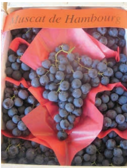
Le Muscat de Hambourg