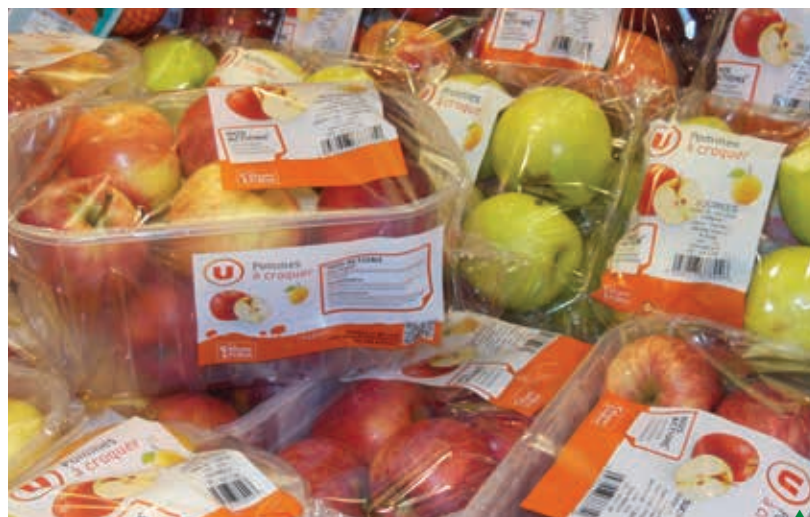
L'assortiment de produits préemballés est fonction du type de point de vente

Si le critère âge discrimine, le revenu semble l'être un peu moins. Il n'y a que les ménages les plus aisés qui sous-achètent des fruits ou des légumes préemballés, sauf pour les références les plus chères (cerise, mangue, haricot vert...). Les autres tranches de revenu et notamment les plus modestes achètent dans des quantités équivalentes à la moyenne nationale. Le positionnement 1 er prix du préemballé explique vraisemblable-