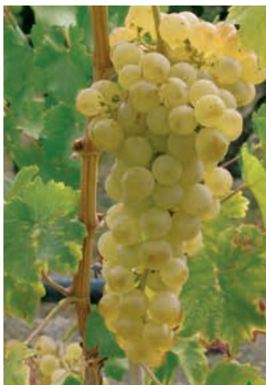
Chasselas de Moissac

Au-delà des traditionnels Chasselas de Moissac et Muscat du Ventoux, l'évolution variétale du raisin de table se développe en France et mérite de se pencher sur d'autres variétés dont certaines sont aujourd'hui familières. D'aspects prometteurs, elles vont dans les prochaines années bouleverser l'implantation du point de vente avec l'apparition d'une gamme de plus en plus riche, segmentée et répondant aux préférences des consommateurs vers des variétés à gros grains, apyrènes et au goût muscaté. Signalons que sur le plan technique, ces variétés vont également changer les systèmes de conduite. Il n'y aura plus le traditionnel plan vertical classique (ou espalier) ou en lyre qui garantit par son inclinaison une meilleure interception lumineuse par le feuillage et qui protège les grappes du rayonnement solaire direct aux heures les plus chaudes de la journée. Les dernières variétés mise en