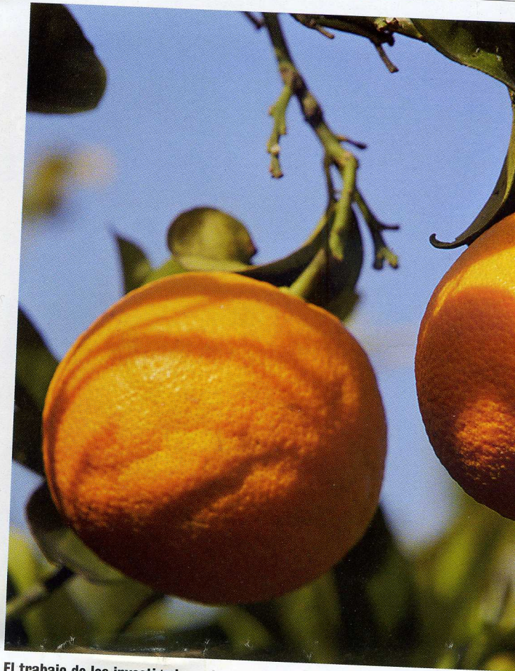
El trabajo de los investigadores ha consistido en transformar plantas de naranja de un gen endógeno que codifica la \beta -caroteno hidroxilasa.

Los carotenoides son los principales pigmentos responsables del color de la piel y de la pulpa